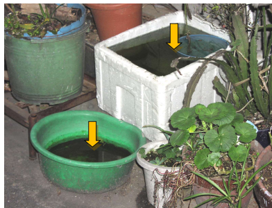
⑤汲み置き水にも注意