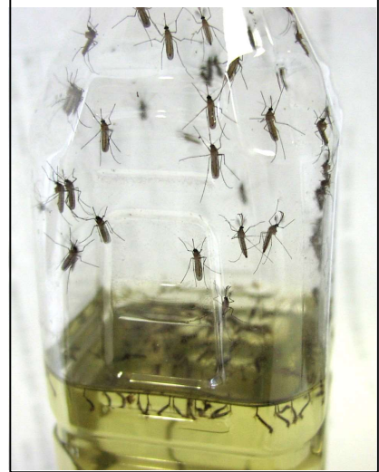
ポイ捨て容器に発生した蚊